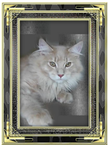
Kater Odin spendete für Kater Charly